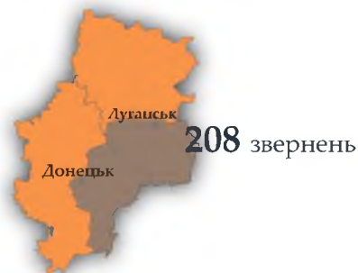
питання, пов'язані із ситуацією у Донецькій та Луганській областях