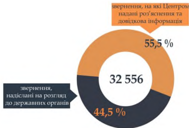
Розподіл звернень за місцем опрацювання