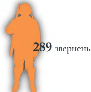
питання, пов'язані з обороноздатністю та проведенням ООС