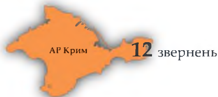
питання вимушених переселенців з АР Крим та м. Севастополя